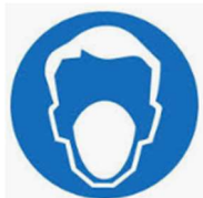
Máscaras Sociais ou Cirúrgicas (obrigatórias)