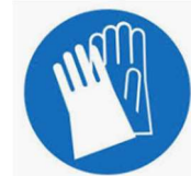
Luvas (obrigatório para o pessoal da limpeza e opcional sempre que se justifique)